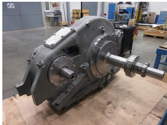
Obrázek 1 CAD model a funkční vzorek vysokorychlostní vlakové převodovky