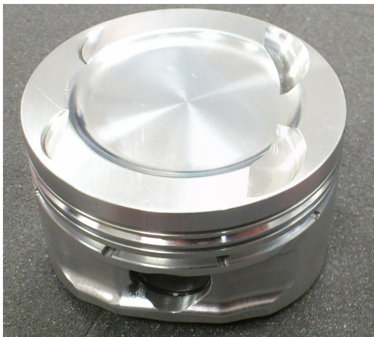
Obrázek 1 Píst CNG 1.4