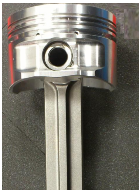
Obrázek 3 Sestava píst a pístní čep